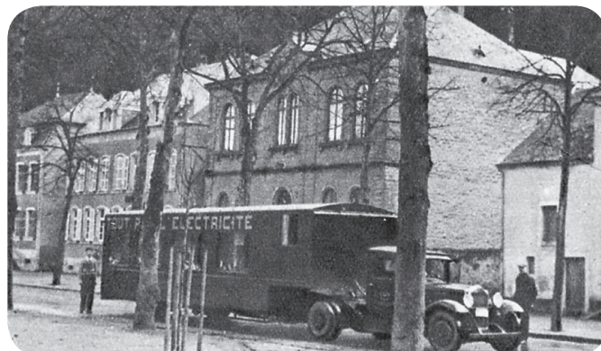
Le véhicule de propagande » en pleine activité.

Et la publicité fonctionne. Le moteur électrique se généralise dans l'artisanat et l'agriculture. Entre 1931 et 1948, la consommation est multipliée par 3,3. 500 appareils de cuissons électriques trouvent preneur en 1937 pour 680 appareils en 1938.