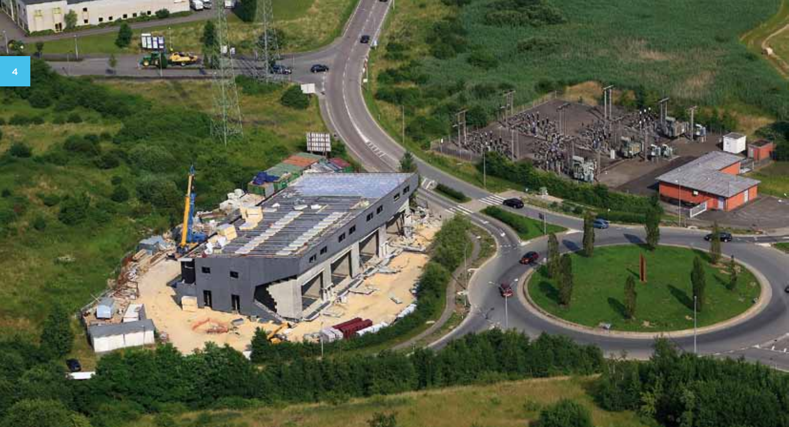
Construction du nouveau poste blindé d'Ehlerange (à droite : ancien poste aérien).

Afin de fiabiliser les réseaux, des dispositifs de protection et de sécurisation sont installés sur tout ouvrage et le concept d'alimentation prévoit de façon générale qu'un deuxième moyen ou chemin peut amener l'énergie demandée à l'endroit du besoin. Ces lignes dédoublées empruntent des chemins d'accès différents pour aboutir aux postes de transformation. Ainsi, lorsqu'une intervention technique doit se faire sur une ligne ou sur une partie d'un poste, le courant peut passer par l'autre et le flux d'énergie électrique ne sera pas interrompu. Creos perfectionne en permanence ses installations pour améliorer son service.