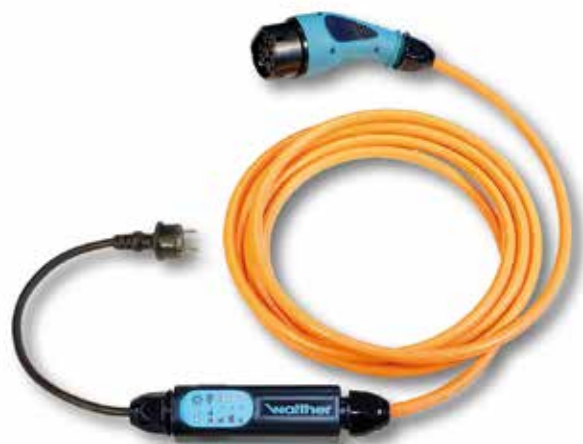
Figure 1 - In-Cable-Control-Box

Beaucoup de câbles de recharge disposent de ce fait d'un dispositif propre au véhicule appelé « In-Cable-Control-Box » (ICCB) - (Figure 1) - qui sert à contrôler les différents facteurs de sécurité lors de la recharge du véhicule. Attention, le poids de l'ICCB peut entraîner des dommages au câble et à la prise, lorsque celui-ci reste suspendu au câble. Il est important de noter que le chargement de la voiture électrique à travers