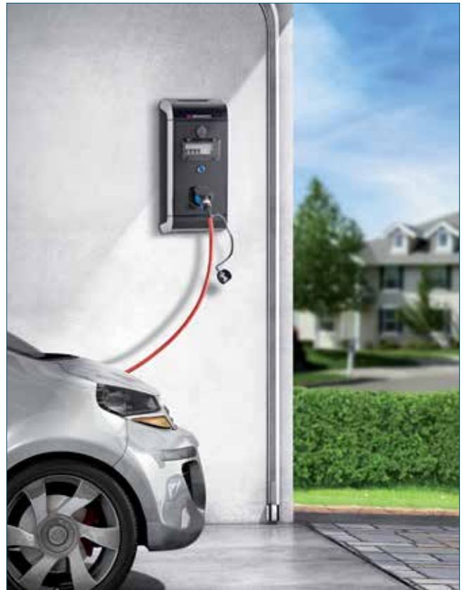
Figure 2 - Borne de recharge

Plusieurs fournisseurs proposent des modèles de bornes de charge avec différentes puissances